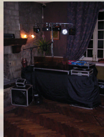
Exemple d'implantation de sono